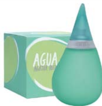
Agatha Ruiz de la Prada